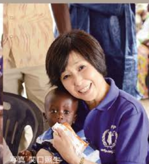
竹下景子さん 国連 WFP 協会親善大使