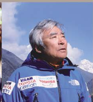
三浦雄一郎さん 国連 WFP 協会親善大使