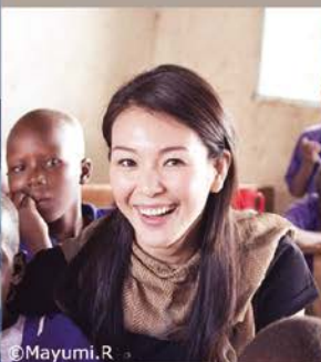
知花くららさん 国連 WFP 日本大使